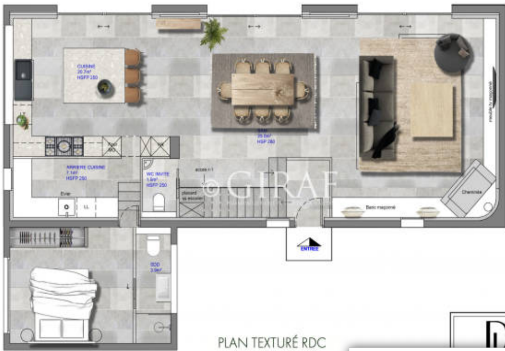
PLAN TEXTURÉ RDC