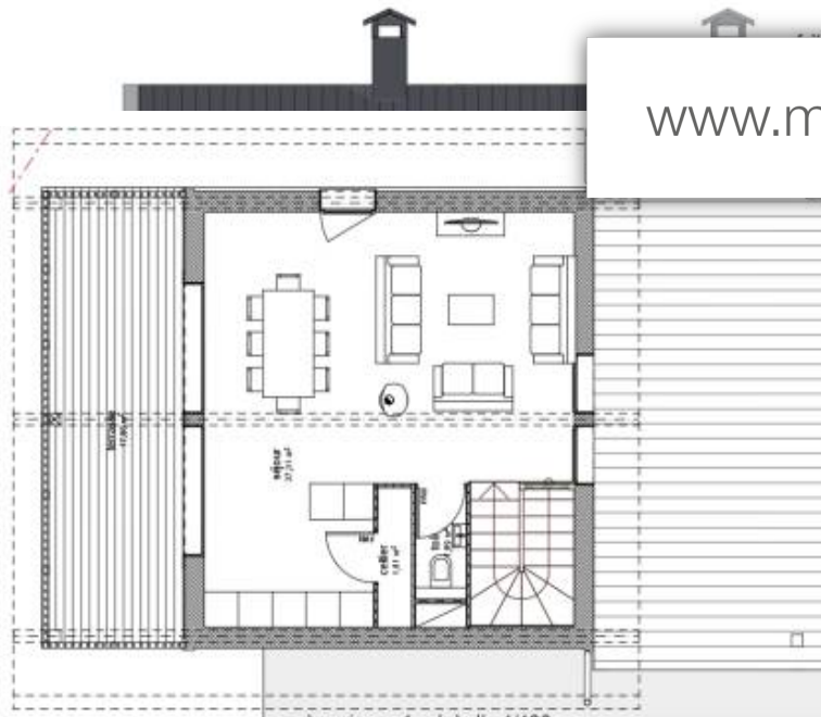
façade nord échelle 1/100