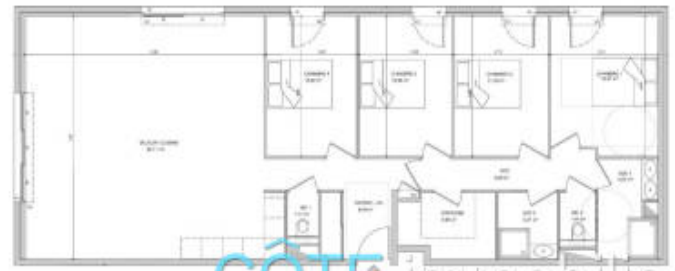
Programme neuf - Convention milancip -