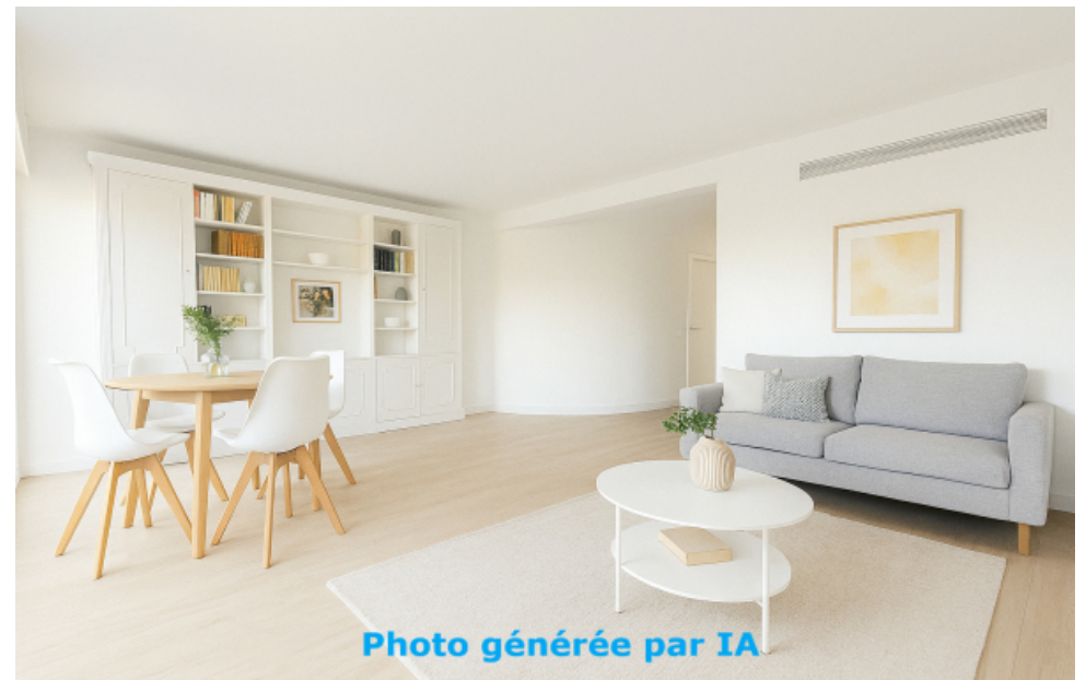
Photo générée par IA