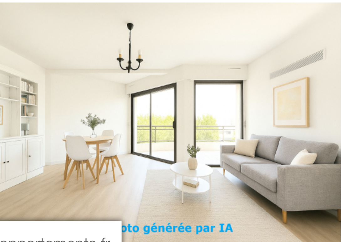
Photo générée par IA